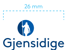
Minstemål – hovedlogo