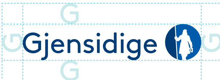
Friareal – horisontal logo