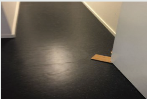
Kritisk forhold: Midlertidig dørstopper