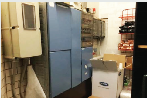
Eltavle ej friholdt.