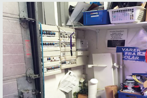
Eltavle ej friholdt.

Læs om skadesforebyggelse på vores hjemmeside: www.gjensidige.dk/virksomhed/godt-forberedt